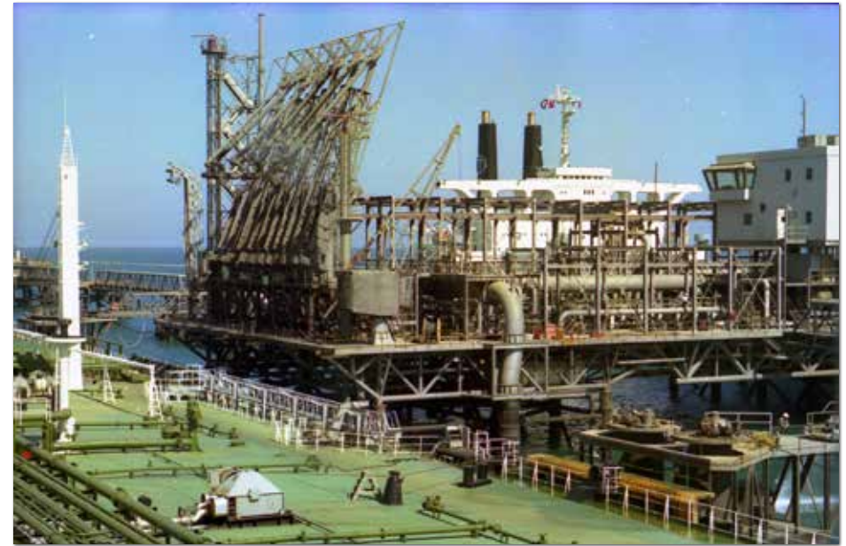
Olie laden op Kharg Island, naast ons de Globtik London, 540.000 ton, 2 x zo groot.