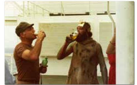
En daar moet op gedronken worden.