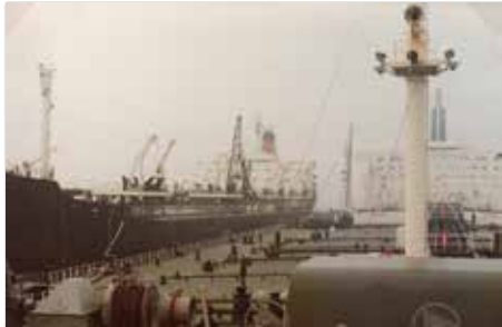
Alles in de mist!