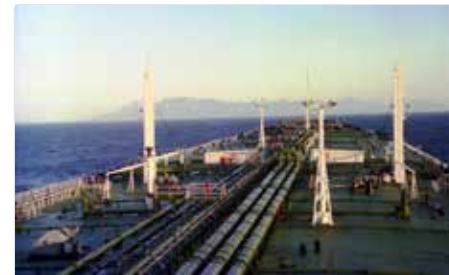
Aanlopen van de Kaap, je mocht niet dichterbij de kust.

De tweede rondreis ging niet naar Frankrijk maar naar Europeoort Rotterdam. Dan moesten we eerst lichten in Lymeby, Engeland omdat we anders te diep staken voor de Europeul die toendertijd nog niet zo diep was als nu.