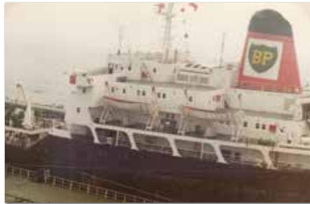
Oliemaatschappijen hadden nog hun eigen schepen!