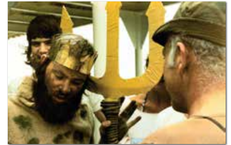
Neptunus, krijgt het commando van de kapitein.

Op de bewuste dag kwam Neptunus na de lunch aan boord. Koning Neptunus kreeg officieel het commando overgedragen van de kapitein. Na de commandooverdracht werd een biertje gedronken op het naderend doopceremonieel.