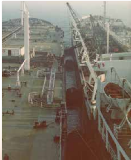
Na een dagje pompen zijn wij 70.000ton lichter en kunnen we de Eurogeul in.