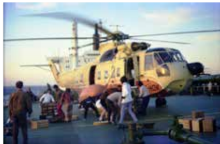
De chef hofmeester met zijn mannen in actie.