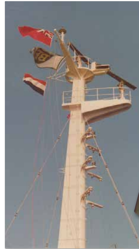
Er werd nog gevlagd zoals het heurde!

Om een indruk te krijgen hoe groot een VLCC is hierbij nog een "plaatje" genomen door een stuurman op een ander Nedloyd schip op het moment dat de Maasbree in ballast het Suezkanaal doorging.