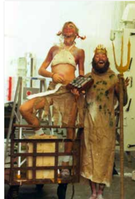
De bakker en de derde wtk als koningin en koning.

Tja, met zoveel nieuwe mensen aan boord waaronder twee meevarende echtgenotes en een evenaar in het verschiep kun je Neptunus met zijn helpers verwachten. Genoeg mensen om een feestje te organiseren. De derde wtk was wel een karakteristiek figuur om voor Neptunus door te gaan terwijl de bakker zich makkelijk kon ombouwen tot koningin.