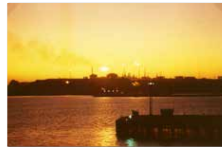
Kharg Island, het gas werd afgefakkelt wat mooie plaatjes oplevert.