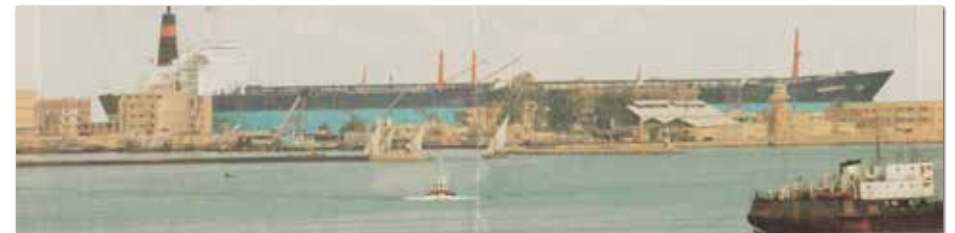
De Maasbree passeert het Suez-kanaal als grootste schip. Het record zou echter al na een maand gebroken worden door de Maasbracht. Deze foto toont de immense afmetingen van de Maasbree.