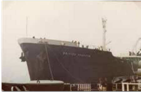
De "British Dragoon", van BP komt langzij.

varend pompten wij zo'n 70.000 ton over in deze tanker zodat onze diepgang wat minder werd.