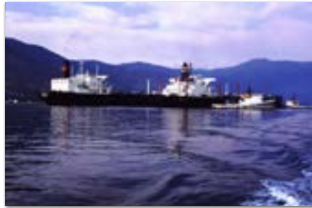
Sao Sebastiao, eerst voor anker en 100.000 ton eruit pompen in een kleinere tanker.