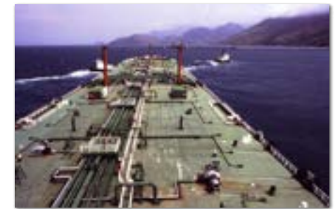
Angra dos Reis, een lange pier ver van de stad.

Angra dos Reis deden we ook wel eens aan. Daar lag de werf van Verolme en je had er een van de eerste kerncentrales van Brazilië. Om uit te gaan was het niet zo geweldig, er was weinig te doen.