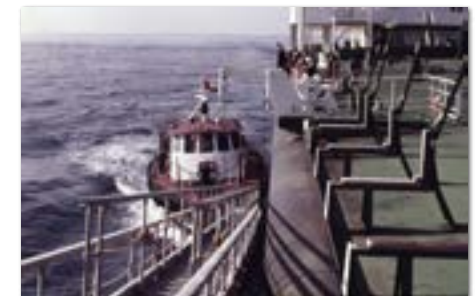
Aan boord in Ras al Kaimah met een bootje van Gray-McKenzie na een tocht door de woestijn.