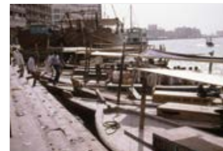
In het oude Dubai, aan de waterkant.

In de Perzische golf werden we meestal in Ras-el Kaimah met een bootje van Gray-McEnzie naar het schip gebracht. Je vloog naar Dubai en werd dan met een busje naar Ras-el Kaimah gereden, dwars door de woestijn en uitkijken voor loslopende kamelen.