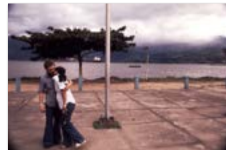
Een goed zeeman verkent land en volk.