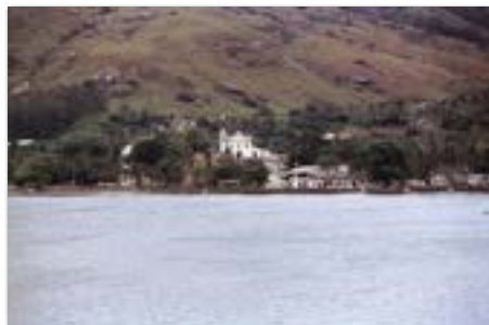
Uitzicht op een dorpje op het eiland Ilha Bela.

Sao Sebastiao was een plaatje. Een klein stadje met een T-vormige pier waar we alleen aan konden meren als er eerst wat lading uit was. Tegenover het plaatsje een schitterend eiland, Ilha Bela wat er ook al even mooi uit zag.