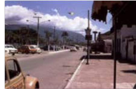
De Boulevard van Sao.

eettentjes en een kroeg. Daarachter midden in het dorp een mooi kerkje.