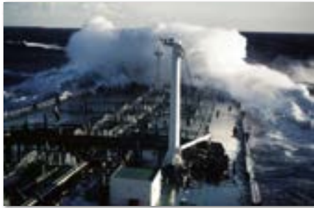
Tussen Afrika en Madagasker kwam er wel eens een beetje water over.