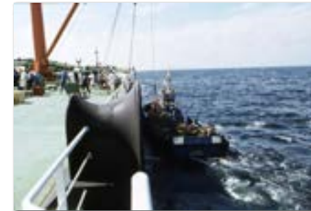
De stores komen bij Kaapstad aan boord.

Aflossen gebeurde in Brazilië of in de Perzische Golf. Het helicoptertijdperk bij Kaapstad was afgesloten. Wel kwamen er nog stores aan boord in Kaapstad. We hadden dan een rendez-vous met een klein supplybootje.