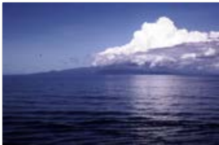
We passeren de Comoren, hoezo, niets te zien op zee. Iedere dag is anders!

De Maasbracht had een charter bij Petrobras voor 5 jaar en voer tussen Ras-Tanoera Saoedi Arabie in de Perzische Golf en Sao Sebastiao of Angra dos Reis in Brazilië.