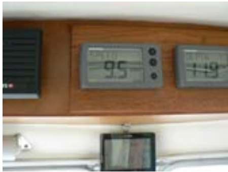
9,5 km/uur door het water; 17,1 km/uur over de grond, tot 17,5 km/uur

Mijn idee om bij Nieuw Statenzijl naar binnen te gaan kan ik vergeten. Afgaand water en zo'n sterke stroom. Het wordt dus Delfzijl, waar ik om 16.15 uur afmeer in jachthaven Neptunus.