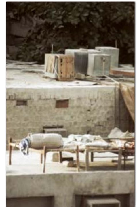
Uitzicht uit het hotel, wij sliepen op een kamer met airco.