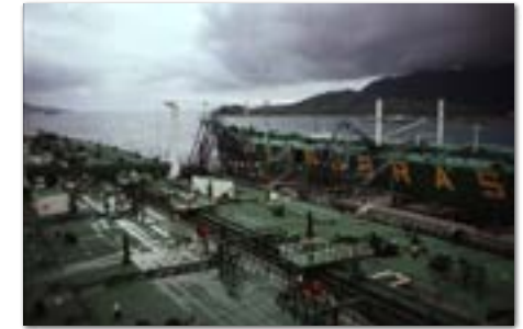
Liggend aan de pier voor de resterende 250.000 ton.

Angra dos Reis deden we ook wel eens aan. Daar lag de werf van Verolme en je had er een van de eerste kerncentrales van Brazilië. Om uit te gaan was het niet zo geweldig, er was weinig te doen.