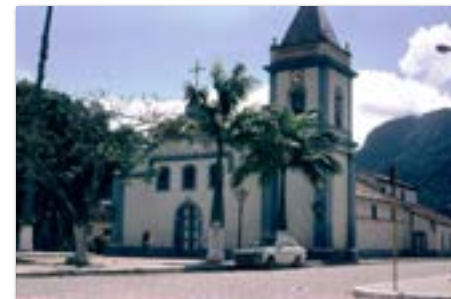
Het kerkje van Sao.