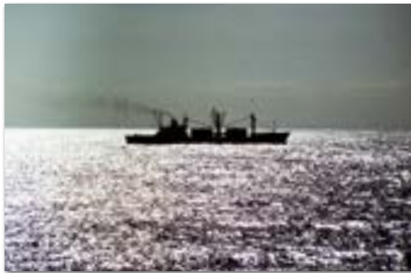
En je komt weleens een schip tegen.