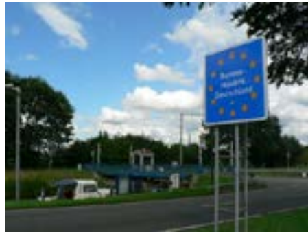
Daar lig ik dan tussen 2 landen. Op het bord op de linkerfoto staat Nederland

De lunchpauze is weer aangebroken, dus ook voor mij. Om 12.45 uur wil ik nog even rond kijken bij de sluis, gaan ze al draaien? Een ambtenaar die te vroeg begint, ik val bijna van mijn stuurstoel. (sorry, overheidsdienaren, ik kon het even niet laten). Daarna weer de nodige bruggen. Je vaart er door en stoomt dan langzaam verder tot het oranje hesje je weer voorbij broemt of fietst. Je krijgt door ervaring kijk op de nodige snelheid, zodat je niet hoeft stil te liggen. Bij de een na laatste sluis voor het kanaal Haren Rütenbrock vertelt de sluiswachter, dat ik daar uiterlijk om 15.30 uur moet zijn om er nog door te mogen. Als alles vlot gaat zou het moeten lukken. Het lukt dus niet, daarvoor is de afstand te groot en er is nog een sluis. De laatste sluis, vlakbij ter Apel, geeft toegang naar het kanaal door een zeer oude, roestige, krakende en piepende hefbrug. Ik was blij er onderdoor te zijn. Zodoende lig ik om 16 uur voor sluis IV van het Haren Rütenbrock kanaal. Ik meld me nog door aan een Leine zu zihen, aber es geht nicht mehr.