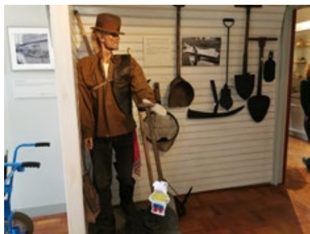
Zoals het vroeger was.