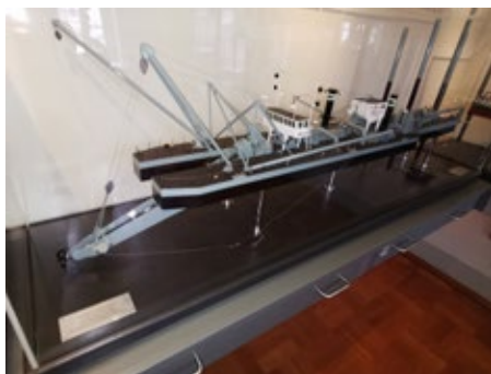
Model van het schip zoals die in het Veluwemeer zand zuigt.