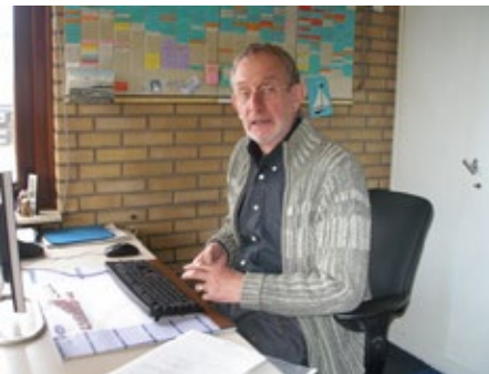
Het oude havenkantoor. 19??