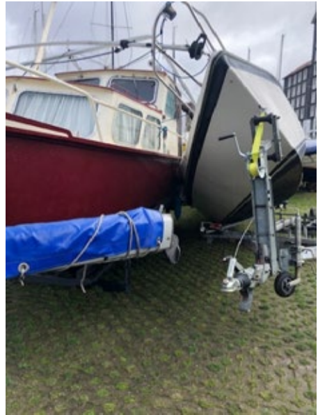
Een verrommelde haven.