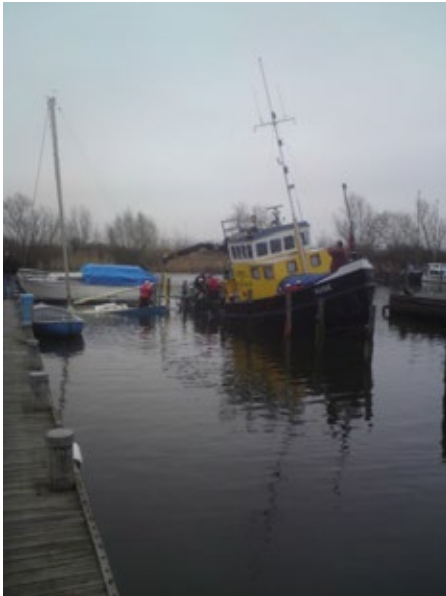
Een winter met gezonken boot in het jaar .....?

Heerlijk om dan vaak in alle stilte met een verwaaid hoofd over de haven te lopen. Eerst ‘s morgens natuurlijk dat bekende bezoek van die mannen die koffie komen drinken.