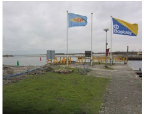
De oude kop van De Knar.

Zij was een beetje boos en zei: "U heeft de code van het hek veranderd." Ik bevestigde dat vermoeden. Kennelijk viel dat niet in