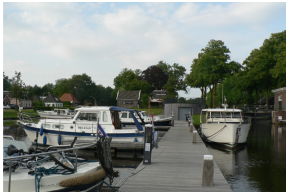
Dieverbrug, een fraaie ligplaats.

Wat ga ik doen? Ik kan door naar Uffelte, maar dan stopt de brugbediening en lig ik waarschijnlijk op de ruimte. In Dieverbrug is een mooie passantenhaven. Betalen met aan/uit + water en elektra. Ik red het toch niet om morgen thuis te zijn, dus ik blijf in Dieverbrug. Daar heb ik nog leuke gesprekken gehad met medewatersporters. Ik heb 23 km gevaren met 4,5 motoruren, maar het duurde 6 uren. (de motor gaat in de sluisen uiteraard uit). De bediening in Friesland is dus van 09.30 uur tot 16.30 uur zonder middagpauze. In Drenthe van 09.00 tot 17.00 uur met een uur middagpauze. Je kunt dus in beide gevallen maximaal 7 uren varen, maar dat lukt niet in de praktijk.