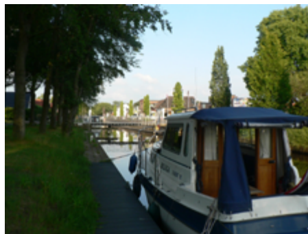
Ligplaats Oosterwolde, winkels vlakbij.

Vrijdag 7 juni. Ik heb alle tijd. De bruggen draaien pas om 09.30 uur. Het regent licht en geen wind. De brugwachter komt langs om te inventariseren wie er door de bruggen wil. Om 09.35 uur vaar ik. 2 schepen varen mee, maar houden zich aan de 6 km/uur. Het schiet niet op. Er moeten 4 sluisen gepasseerd worden en vele bruggen, voordat ik op de Drentse Hoofdsloot ben. Gelukkig blijven de 2 langzaam vaarders in Appelscha achter. Ook daar is het goed aanleggen, maar ik heb daarvoor geen tijd. Ook pensionado's hebben hun afspraken. Bij de tweede sluis weigert de brug open te gaan. Het wordt na een telefoontje snel verholpen. De zelfbedieningsbruggen worden door een jongenman opengedraaid. Uiteraard komt er een klompje aan een hengel naar mij toe. Dat scheelt een hoop gedoe. Om 12.45 uur ben ik bij de brug naar de Drentse Hoofdvaart. Die draait om 13.00 uur. Tot nu toe ging ik in de sluisen omhoog tot ca. 11 m. boven NAP. Nu ga ik weer zakken en dat gaat veel comfortabeler. Er spuit geen water naar binnen en je zakt gestaag. De Veenesluis en de Haarsluis gaan vlot. Om 15.40 uur ben ik door de Dieversluis.