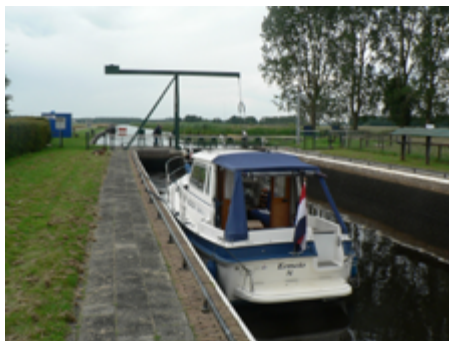
Sluis I in de Tjonger.

In 2024 heb ik het plan om het andere deel van de Turfroute te varen, te weten naar Oosterwolde en Appelscha. Op donderdag 6 juni lig ik in Joure. Het is D-day en stemmen voor het EP. De zon schijnt, wind Z 4. Ik zou zaterdag weer thuis komen, dus het moet nog kunnen om via Oosterwolde de Turfroute af te maken. Het is 52 km naar Oosterwolde (over de Tjonger) maar ik vergis me schromelijk in de tijd die dat neemt. Na een paar boodschappen in Joure vertrek ik om 08.45 uur. Om ca. 10.00 uur ben ik op het Tjeukermeer, waar het flink schommelt. Via Fjouwerhus naar de Tjonger. Tegen 12.00 uur ben ik in Mildam en daarna bij sluis I. Omdat er iemand van de andere kant was aangemeld, stonden de deuren voor mij niet open, maar die tegenligger komt niet opdagen. Vervolgens zitten er zoveel plantenresten tussen de deuren, dat ze later ook niet dicht willen. Dat duurt bij elkaar een half uur. Sluis II gaat sneller en ook sluis III. Om 15.30 uur ben ik bij de sluis in Oosterwolde en om