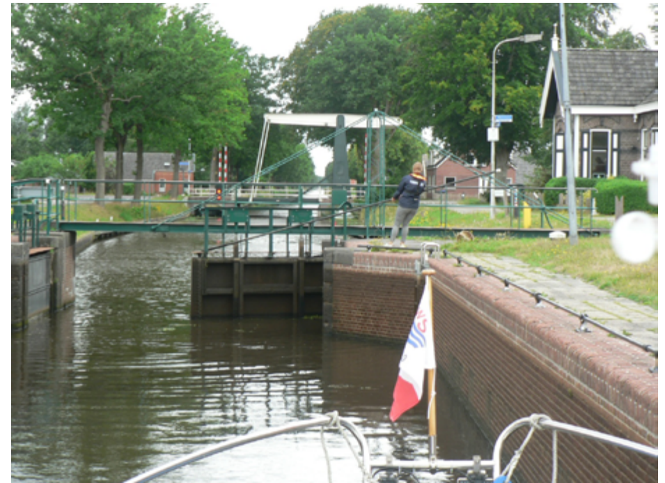
Dubbel rood op de brug was een fout in het systeem.

Woensdag 1 juli. In het gehele land is regen voorspeld, maar ik word wakker met zon en die blijft, op een paar lichte buitjes na. De wind is eerst zwak, maar wordt later toch weer stevig ZW 4-5. Ik kan pas om 09.30 uur vertrekken omdat de brug niet eerder draait. Om 09.35 uur is de brugwachter er en gaat mee naar alle bruggen. Zeer comfortabel vaar ik door Gorredijk, aansluitend aan 2 andere schepen. Om 10.20 uur ben ik door Gorredijk. Er zijn mooie aanlegplaatsen in Gorredijk, in het centrum die heb ik dus gemist. Om 12.00 uur ben ik in Oldeboorn, maar volgens mijn info dan draaien de bruggen niet. Maar ze draaien wel, 3 voetbruggen.